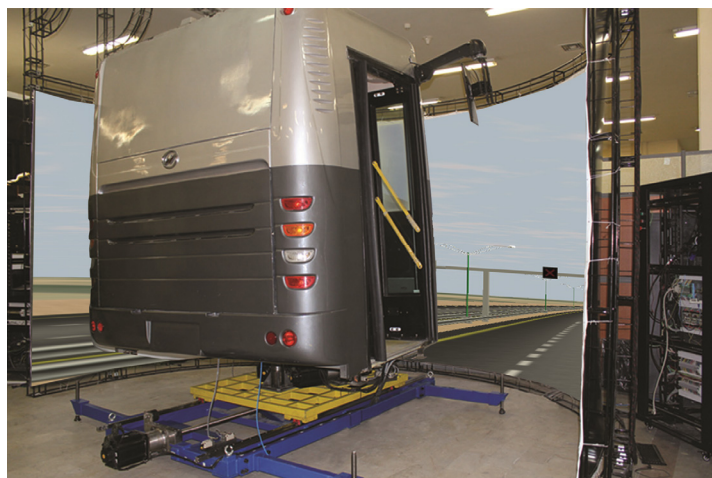
شکل ۱: طراحی و توسعه جاده برای تعیین حالت خواب‌آلودگی راننده

خواب‌آلودگی راننده از طریق ترکیب چند روش مختلف انجام شده است. همچنین با توجه به گسترده و متنوع بودن مطالعات موجود در این زمینه و عدم بررسی مزیت‌ها و محدودیت‌های هر کدام از این روش‌ها به صورت مجزا و توأم، این مطالعه به صورت مروری با هدف بررسی مطالعات سنسورهای تشخیص‌دهنده خواب‌آلودگی راننده و ارائه روش‌های ترکیبی تشخیصی و طرح مدل کارآمد انجام گرفت.