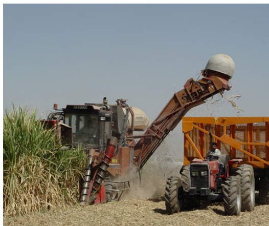
شکل ۱: ماشین برداشت (دروگر) نیشکر کیس مدل آستافت ۷۰۰۰

شاخص استرین فیزیولوژیکی (بدون بُعد)، دمای دهانی در حالت کار (درجه سلسیوس)، دمای دهانی در حالت استراحت (درجه سلسیوس)، ضربان قلب در حالت کار (ضربه بر دقیقه) و ضربان قلب در حالت استراحت (ضربه بر دقیقه) می‌باشد همچنین، شاخص استرین ادراکی با استفاده از میزان احساس گرمایی و میزان شدت فعالیت اعمال شده ادراکی طبق رابطه (۴) برآورد شد: