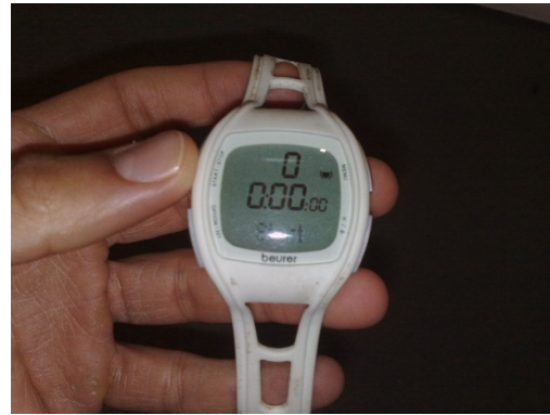
شکل ۲: ضربان‌سنج (سمت راست) و دماسنج دهانی (سمت چپ) استفاده شده در مطالعه

علاوه بر موارد ذکر شده، سابقه گرم‌زدگی، آسیب‌دیدگی حین کار و سابقه مشکلات عضلانی-اسکلتی با پرسش از کاربران در مورد وقوع هر یک از آن‌ها در یک سال گذشته انجام و پاسخ‌ها به صورت «بله یا خیر» ثبت شد. برای بررسی میزان رضایت شغلی کاربران دروگر نیشکر، از مقیاس آنالوگ بصری استفاده شد با این تفاوت که در کنار اعداد صفر و ده به ترتیب عبارت‌های «کاملاً ناراضی» و «کاملاً راضی» نوشته شد.