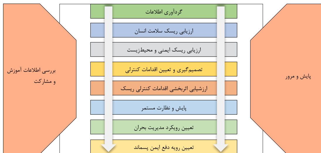
شکل ۳: فرایند کلی توسعه یافته در مدیریت ریسک نانومواد مهندسی‌شده (۴۹، ۵۰)

در شکل (۱)، اجزای کلیدی چارچوب مدیریت ریسک نانو مواد مهندسی‌شده بسته به منابع مختلف، شامل گروه بندی مواد براساس ارزیابی خطر مطابق خواص فیزیکی شیمیایی نانو مواد، مانند سمیت، واکنش‌پذیری و اشتعال‌پذیری (۱۶، ۳۰)، ارزیابی مواجهه از مسیرهای احتمالی مواجهه انسان و محیط‌زیست با نانو مواد (۳۰، ۳۱)، رویکرد چرخه عمر و برقراری ارتباط (۱۵، ۳۲)، مدیریت ریسک با استراتژی کاهش مخاطرات (۲۹، ۳۳) و تحقیق برای ارتقای دانش موجود از نانو مواد (۳۰) معرفی می‌شود. با وجود گذشت حدود ۲ دهه از آغاز پیاده‌سازی مقررات و اجرای تحقیقات گسترده، اطلاعات در حوزه سمیت نانو مواد همچنان کمیاب و غیرقابل اعتماد بوده، شکاف‌های اطلاعاتی، چالش‌های موجود در دستورالعمل‌های ایمنی و بهداشت و روش‌های استاندارد انجام کار با نانو مواد مهندسی‌شده وجود دارد (۲۶، ۳۴، ۳۵). لینکوف و همکارانش (۲۰۰۸) چارچوب‌های