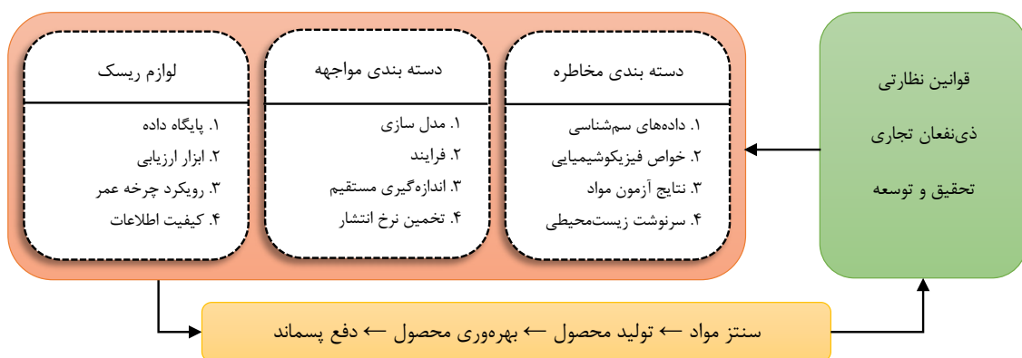
شکل ۴: ساختار پیشنهادی یک چارچوب جامع برای مدیریت ریسک نانومواد مهندسی شده

فرایند کلی توسعه یافته در مدیریت ریسک نانو مواد مهندسی شده در شکل (۳) بیان شده و در جدول (۱) چارچوب‌ها بر اساس رویکرد ارزیابی ریسک، دیدگاه چرخه عمر، مجهز بودن به پایگاه داده‌ها و توسعه ابزارهای ارزیابی در بستر خود و بررسی شدند. رویکرد ارزیابی ریسک به روشی اشاره دارد که برای ارزیابی خطرات بالقوه و مواجهه با نانو مواد و اثرات آن‌ها بر سلامت انسان و محیط‌زیست به سه صورت کمی، نیمه کمی و کیفی مورد استفاده قرار می‌گیرد (۲۴، ۳۸). ارزیابی چرخه عمر تکنیکی است که جنبه‌های زیست‌محیطی و اثرات بالقوه یک محصول را در طول چرخه عمر آن، از استخراج مواد خام تا دفع، در نظر می‌گیرد (۱۵). در پایگاه داده یک چارچوب یا ابزار، اطلاعات مربوط به نانو مواد مانند