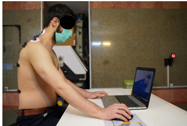
شکل ۱: ایستگاه کاری مورد استفاده در این پژوهش