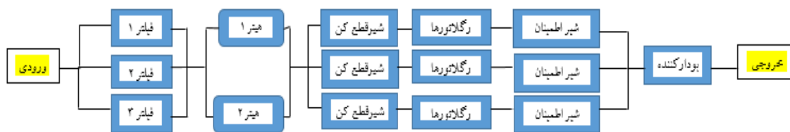
شکل ۱. نمودار بلوکی ایستگاه تقلیل فشار گاز CGS

یکسان هستند. اجزای اصلی این ایستگاه‌ها شامل موارد زیر است: