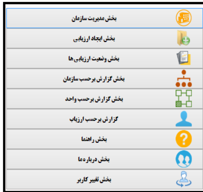
شکل ۳. بخش‌های اصلی تشکیل‌دهنده سطح دسترسی مدیر در نرم‌افزار ارزیابی عملکرد سیستم مجوز کار