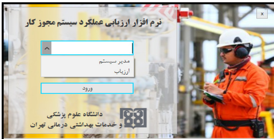
شکل ۲. صفحه اصلی ورود به نرم‌افزار و انتخاب نوع سطح دسترسی

جهت ایجاد یک ارزیابی را در بخش مدیریت سازمان نرم‌افزار تعریف می‌کند.