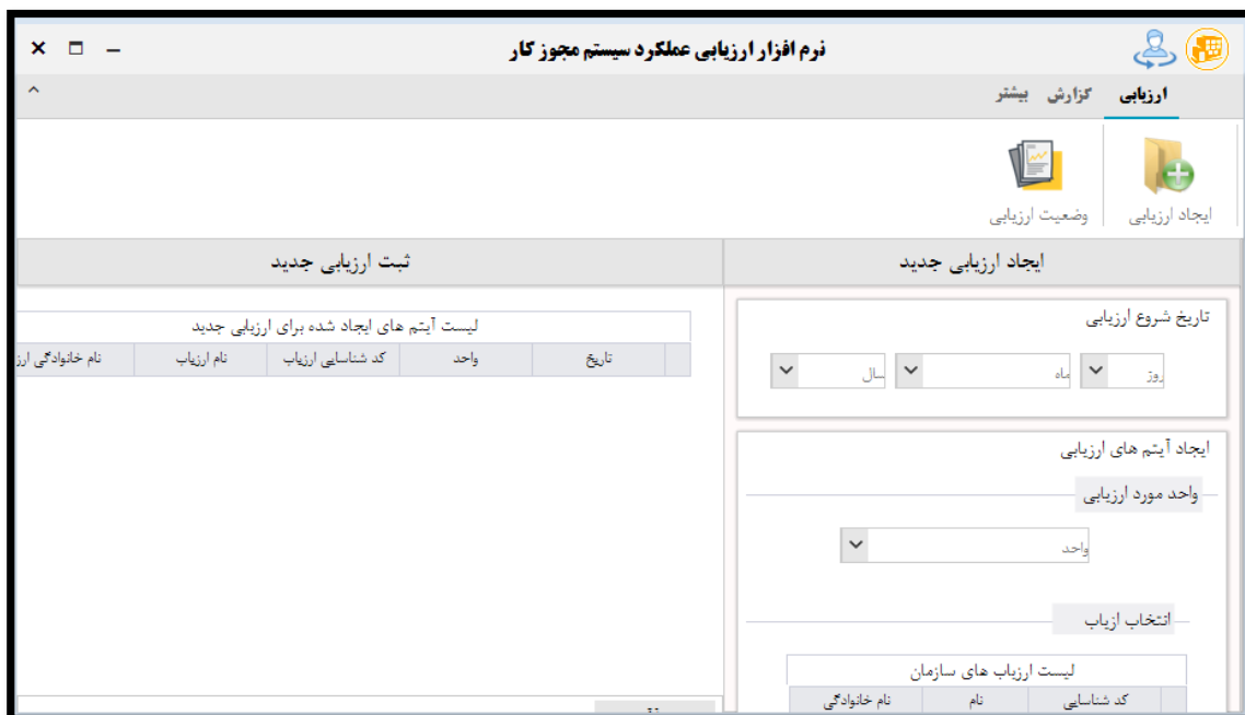
شکل ۴. نحوه ایجاد یک ارزیابی در بخش مدیریت سازمان نرم‌افزار ارزیابی عملکرد سیستم مجوز کار