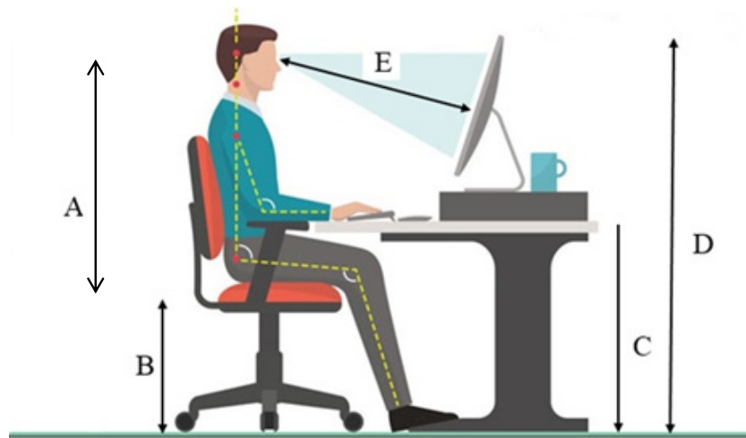
شکل ۱. ارتفاع چشم نشسته (A)، ارتفاع نشیمنگاه (B)، ارتفاع میز (C)، ارتفاع لبه فوقانی مانیتور (D)، فاصله چشم تا مرکز مانیتور (E)

این متون با فونت و اندازه مشخص در مرکز صفحه‌نمایش کامپیوتر نشان داده می‌شود. جهت اعتبارسنجی و ارزیابی صحت و دقت نرم‌افزار طراحی‌شده، تعداد پلک زدن در چند فیلم به صورت تصادفی و دستی (چشمی) شمارش شد. این فیلم‌ها در نرم‌افزار فراخوانی شده و مجدداً با استفاده از نرم‌افزار شمارش به صورت اتوماتیک انجام شد. سپس، میزان همبستگی و دقت موردبررسی قرار گرفت و نتایج نشان داد نرم‌افزار با ضریب همبستگی ۰/۹۵ از دقت بالایی در شمارش صحیح و دقیق نرخ پلک برخوردار است. در این مطالعه سرعت پلک زدن افراد نیز موردبررسی قرار گرفت. جهت تعیین سرعت پلک زدن، زمان بسته و باز شدن کامل چشم برحسب میلی‌ثانیه در نظر گرفته شد. اساس کار جهت تعیین سرعت پلک زدن (زمان باز و بسته شدن چشم) بدین صورت است که زمانی که چشم در حالت باز و خواندن متن می‌باشد به صورت چشم باز در نظر گرفته می‌شود و به محض اینکه پلک حرکت کرده و فرآیند پلک زدن آغاز می‌شود، محاسبه زمان بسته و باز شدن چشم تا باز شدن کامل چشم شروع می‌شود. در خصوص نحوه کار با نرم‌افزار، به‌طور کلی، تصاویر ضبط‌شده از چهره افراد، در نرم‌افزار فراخوانی شده و آنالیزهای مربوطه هر بار به صورت مجزا انجام می‌گرفت. در انتها، خروجی به صورت اکسل نمایش داده شده