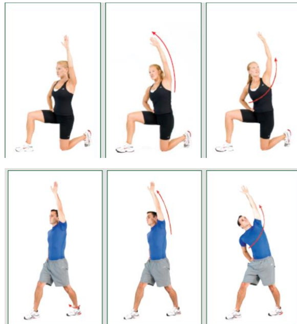
شکل ۱. نمونه ای از تمرینات کششی و انعطاف پذیری ایستا در تمرینات حرکات اصلاحی (۲۸).

و شغلی کارکنان با شیوع و شدت اختلالات، میزان استراحت و کاهش فعالیت کاری در طول یکسال و ۷ روز گذشته از آزمون وی کرامر استفاده شد. روابط بین متغیرهای میزان کاهش شیوع اختلالات اسکلتی - عضلانی در نواحی با شیوع بالاتر (متغیر کیفی اسمی به صورت داشتن یا نداشتن ناراحتی) و کل بدن (فراوانی اظهار درد در نواحی ۹ گانه بدن) در طی ۷ روز گذشته، قبل و بعد مداخله آموزشی حرکات اصلاحی به ترتیب با استفاده از آزمون های مک نمار و ویل کاکسون مورد بررسی قرار گرفت. کلیه آنالیزها با استفاده از نرم افزار spss نسخه ۲۳ انجام شد.