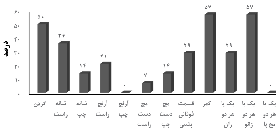
نمودار ۱. درصد میزان شیوع ناراحتی اسکلتی - عضلانی در نواحی مختلف بدن کارکنان در طی یکسال گذشته براساس پرسشنامه نوردیک (n=۱۴)

مداخله نبوده و فقط در طول یک هفته گذشته بررسی شده است.