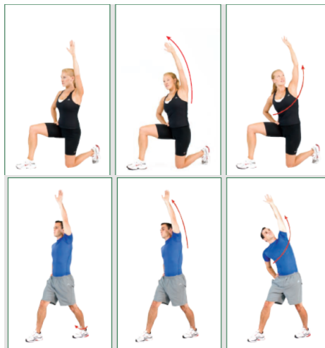
Fig. 1. An example of static stretching and flexibility exercises in corrective exercises (8).

Based on this study results, the mean and standard deviation of age and height of employees are 38.71 \pm 6.36 years and 172.85 \pm 16.3 centimeters. The musculoskeletal discomfort rate in the different regions of the body of employees' participated in the training course during the last 7 days before and after training intervention has been reported in Fig. 2.