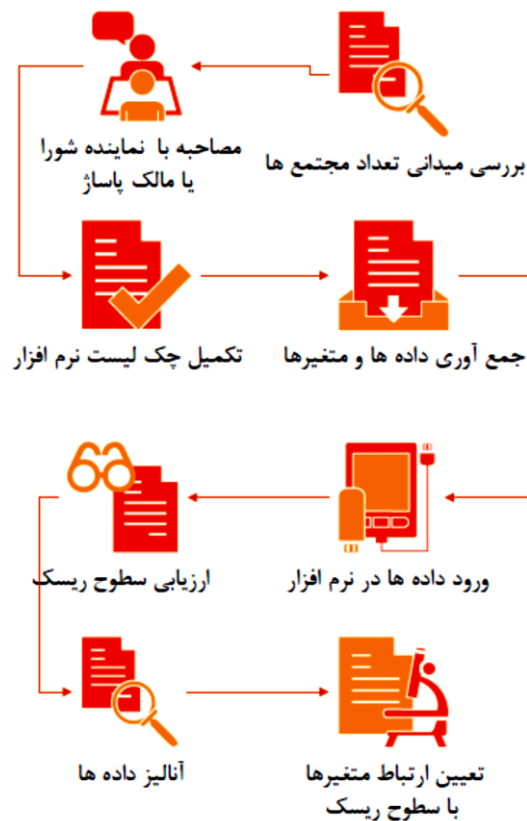
شکل ۱- فلودیاگرام روش بررسی مطالعه

بازار و مداخلات آموزشی در بین شاغلین بایستی انجام گردد (۵). مطالعه حاضر سعی در جبران این خلاء نموده است. به منظور بررسی وضعیت ایمنی مجتمع‌های تجاری تهران، ناحیه منطقه ۱۲ شهرداری که دارای بیشترین تراکم مجتمع‌ها بوده و دارای اهمیت استراتژیک سیاسی، اقتصادی، فرهنگی و تاریخی می‌باشد، جهت اجرای مطالعه انتخاب گردید.