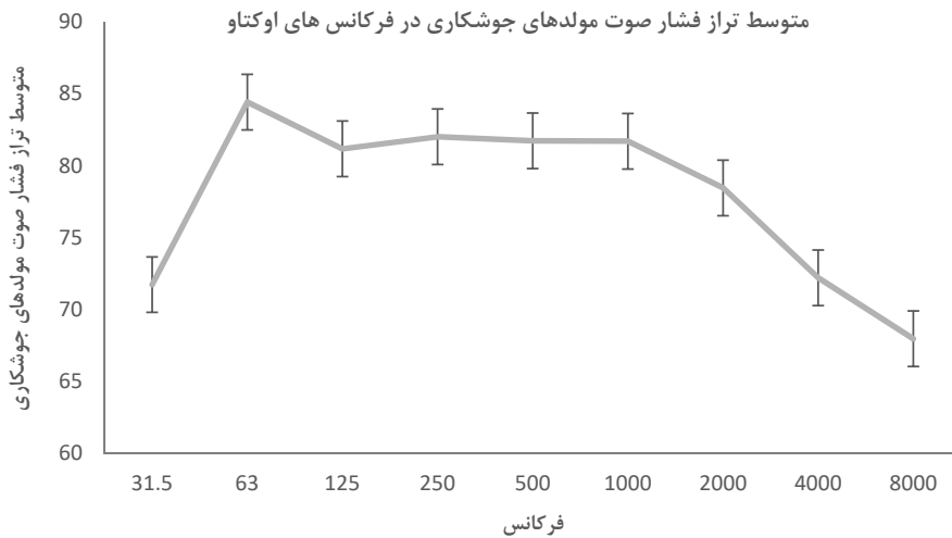
شکل (۲) - متوسط تراز فشار صوت مولد های جوش کاری در فرکانس های اوتکت

که در شرایط خاموش بودن مولد های دیزلی اندازه گیری شده بود، از حدود مجاز سازمان محیط زیست (۵۵ دسی بل در طی ساعات ۸ صبح الی ۱۰ شب) تجاوز کرده بود و این تجاوز از حدود مجاز به دلیل صدای ناشی از ترافیک و تردد خودروها در اطراف سایت های ساخت و ساز بود. (جدول ۱) لذا با توجه به صدای زمینه موجود، حتی در شرایطی که مولدهای دیزلی خاموش هستند صدا از حدود مجاز سازمان محیط زیست تجاوز خواهد کرد و در صورت استفاده از استاندارد موجود سازمان محیط زیست ارزیابی صحیحی از صدای ناشی از مولد های دیزلی صورت نخواهد گرفت. در این مطالعه، حدود مجاز صدای محیط زیستی با اقتباس از استاندارد BS 5228 (صدای زمینه به اضافه ۵ دسی بل) بر اساس صدای زمینه موجود در هریک از سایت های ساخت و ساز به دست آمد، لذا هریک از سایت های ساخت و ساز حدود مجاز مختص به خود را خواهد داشت. متوسط تراز صدای زمینه در ۱۴ سایت ساخت و ساز بررسی شده در این مطالعه ۴۶/۲۰ دسی بل اندازه گیری