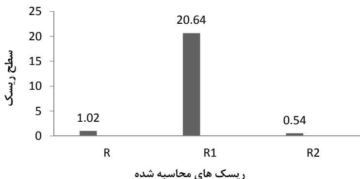
شکل ۲. سطح ریسک برای ساختمان و محتویات ( R )، ساکنین ( R_1 ) و فعالیت ها ( R_2 ) در وضعیت موجود

در این پژوهش از روش ارزیابی مهندسی ریسک حریق FRAME، جهت تعیین کمی ریسک حریق ساختمان، فعالیت ها و ساکنین اتاق کنترل استفاده شد. نتایج نشان می دهد، ریسک حریق برای ساکنین ( R_1 )، با میزان ۲۰/۶۴ بالاترین سطح را دارد. ریسک حریق ساختمان و محتویات ( R ) نیز ۱/۰۲ به دست آمد. از آن جا که مطابق راهنمای روش FRAME، سطح ریسک قابل قبول کم تر از ۱ می باشد، لذا ریسک حریق ساکنین و ساختمان و محتویات در این پژوهش در