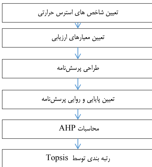
شکل ۱. مراحل انجام تحقیق

یکی از مهم‌ترین سوالاتی که در ذهن متخصصان ایمنی و بهداشت حرفه ای وجود دارد این است که بهترین شاخص ارزیابی استرس‌های حرارتی با توجه به گستردگی آن که بتوان نتایج قابل قبولی را داشته باشد چیست؟ و چگونه می‌توان آن را مورد قبول قرار داد. لذا در این تحقیق با هدف تعیین شاخص بهینه استرس حرارتی در صنایع گرم به اجراء در آمد.