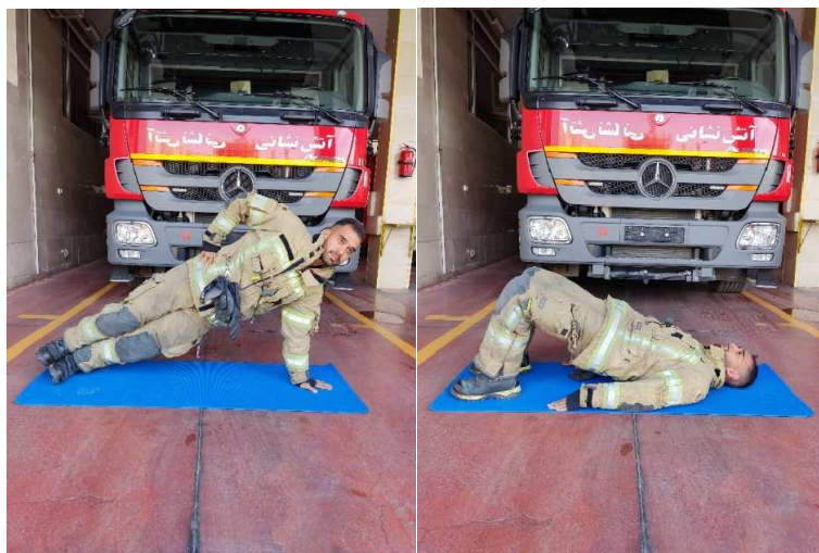
شکل ۳: تمرینات ثبات مرکزی