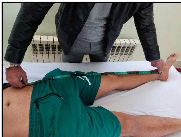
شکل ۱: آزمون طول طبیعی پا

این مدل بمنظور بررسی اثر بین گروهی نوع تمرینات (ثبات مرکزی و عملیاتی-مهارتی)، و اثرات درون گروهی نوع لباس (نجات، حریق و هزمت) و زمان اندازه گیری (پیش آزمون، پس آزمون و ماندگاری) بر تعادل آتش نشانان استفاده شد. پذیره های زیربنایی این مدل شامل نرمال بودن توزیع خطا با استفاده از آزمون شاپیروویلک، همگنی واریانس خطا با استفاده از آزمون لوین و همگنی ماتریس واریانس کوواریانس با استفاده از آزمون باکس بررسی و تایید شد. در مقایسه ی ویژگی های فردی بین دو گروه، با توجه به نرمال بودن توزیع داده ها، از آزمون تی مستقل استفاده شد. تحلیل در سطح خطای پنج درصد و با استفاده از نسخه ۲۶ نرم افزار SPSS انجام شد.