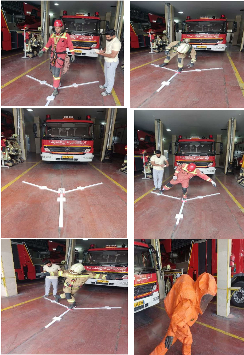
شکل ۲: آزمون تعادل Y

در حالت درازکش به پشت قرار گیرند، سپس فاصله بین خار خاصه قدامی فوقانی تا بخش دیستال قوزک داخلی پا اندازه‌گیری می‌شد. برای هر آزمودنی و هر پا ۲ مرتبه تکرار و میانگین گرفته می‌شد (شکل ۱). سپس میانگین محاسبه