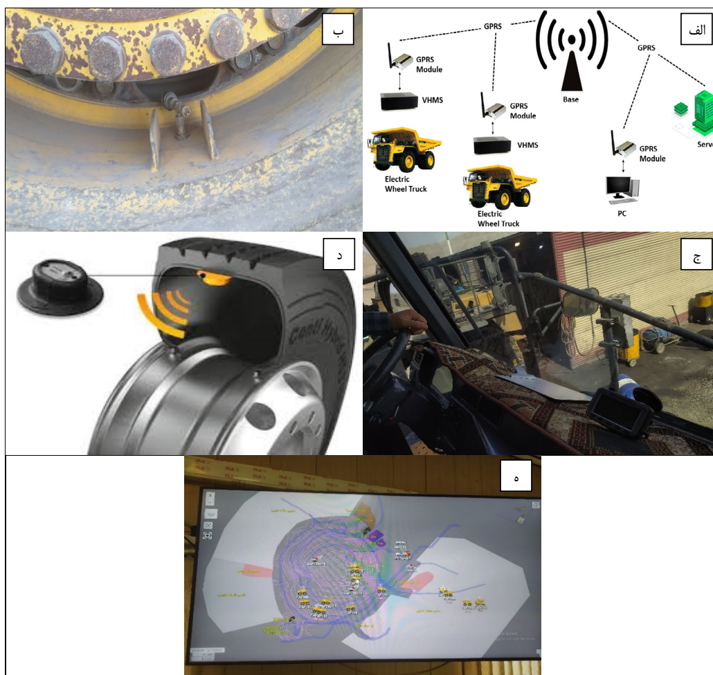
شکل ۱: سامانه‌های هوشمند ماشین‌آلات در صنعت معدن مورد بررسی در این مطالعه: (الف) عملکرد سیستم نظارت بر سلامت خودرو (VHMS: vehicle health monitoring system)، (ب) نمایی از سوپاپ سیستم نظارت بر فشار باد تایر (TPMS: tire pressure monitoring system)، (ج) نمایشگر سیستم نظارت بر فشار باد تایر (TPMS: tire pressure monitoring system) در کابین راننده، (د) شماتیک قرارگیری سنسور سیستم نظارت بر فشار باد تایر (TPMS: tire pressure monitoring system)، (ه) نمایشگر سیستم مدیریت ناوگان (Dispatching) در اتاق کنترل