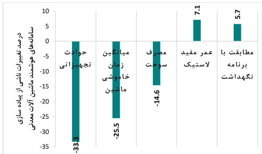
شکل ۳: میزان اثربخشی استفاده از سامانه‌های هوشمند ماشین آلات معدنی بر پارامترهای تعریف شده