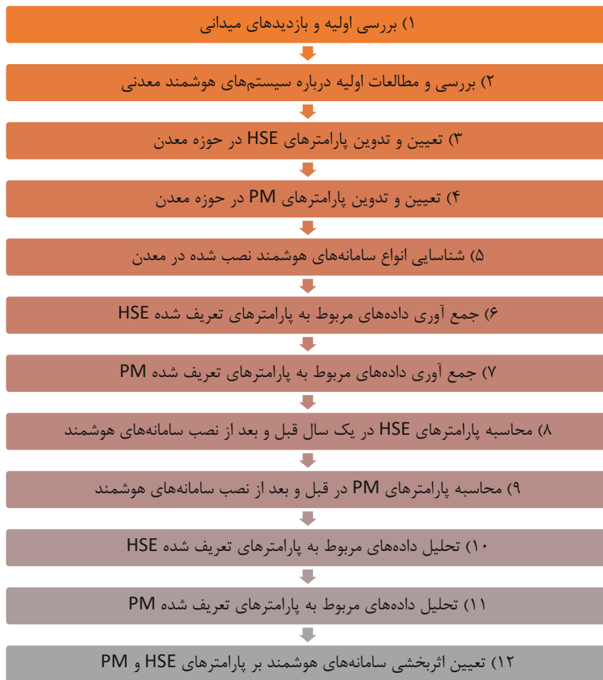
شکل ۲: گام‌های دوازده‌گانه تحقیق در سه بخش (بررسی اولیه و شناسایی پارامترها، جمع آوری و تحلیل داده‌ها)

گردید. لازم به ذکر است تمامی داده‌های جمع‌آوری شده پیش از آغاز آنالیز نرمال گشته‌اند.