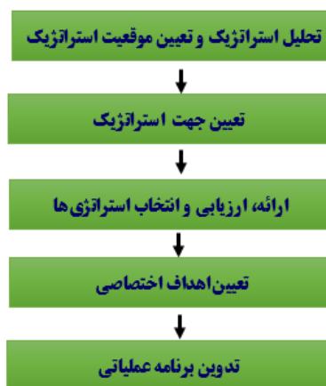
شکل ۱: مدل برنامه‌ریزی استراتژیک مصدق‌راد (۱۰)

کمیته برنامه‌ریزی استراتژیک شامل ۱۷ نفر از اساتید و کارشناسان گروه‌های آموزشی بهداشت حرفه‌ای و علوم