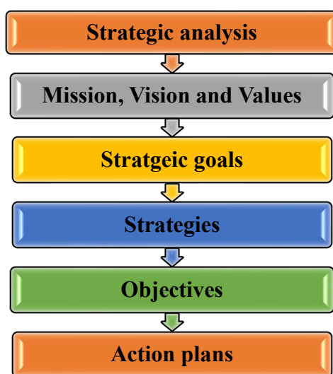
Fig. 1: The strategic planning model

Collaboration between the occupational health department of the school of public health and health deputy of TUMS is essential. The participation of the latter in the educational and research activities of the occupational health department of school of public health leads to the strengthening and development of the competencies of the occupational health students, who should then work in the industry. On the