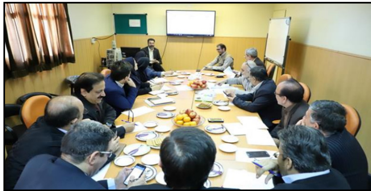
شکل ۳: ماتریس استراتژی های پیشنهادی (۱۰)