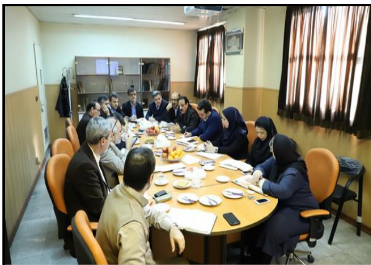
تصویر ۱: جلسات برنامه‌ریزی استراتژیک گروه‌های بهداشت حرفه‌ای دانشگاه علوم پزشکی تهران