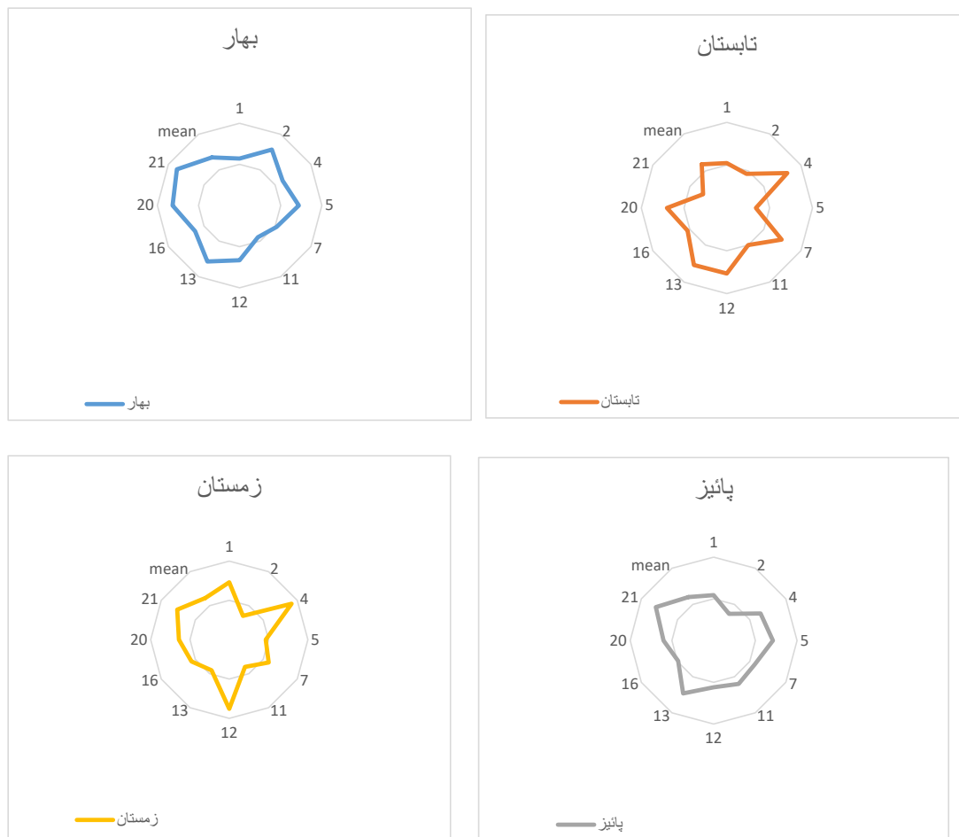
شکل ۲: نمودار میانگین غلظت الیاف آزبست f/ml در فصول و مناطق مختلف شهر تهران

غلظت آزبست در این مناطق می‌شود (۳). با در نظر گرفتن نتایج اندازه‌گیری مرتبط با فصول مختلف سال، میانگین غلظت الیاف آزبست در فصل بهار ۲۶/۸ برابر حد مورد مجاز توصیه شده، در فصل تابستان ۲۳/۴ برابر حد قابل پذیرش، در فصل پاییز ۲۴ برابر حد مورد قبول و در فصل زمستان ۲۴/۴ برابر حد مورد قبول گزارش گردید، که نتایج مطالعه حاضر با مطالعه لطفی و همکاران (۱۳۹۰) در شهر تبریز (تقریباً ۱۸/۸ برابر) مطابقت دارد (۳). هر چند در شهر بزرگ تهران با توجه به تعداد بیشتر خودروها، حجم بالای ترافیک و تعداد بیشتر تخریب ساختمان‌ها ممکن است مقادیر بالاتری از الیاف آزبست در هوای شهرها نسبت به سایر شهرهای