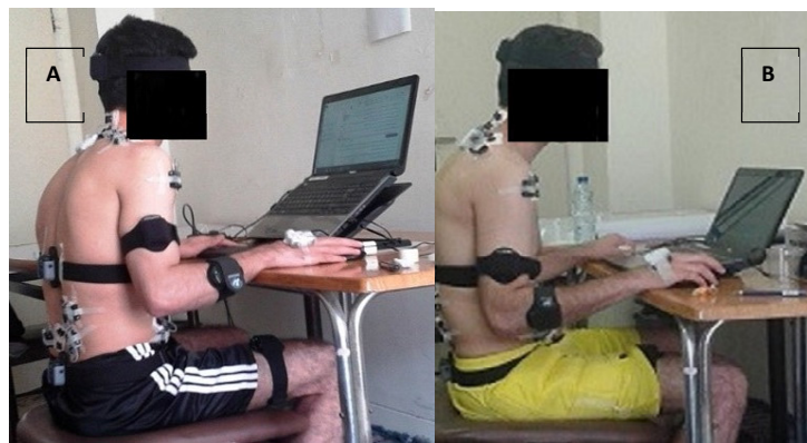
Fig. 1. The participants working with laptop in the ergonomic (A) and conventional (B) setups

In this study, 20 young healthy male university students (age: 27.05 \pm 3.5 years, height: 176.9 \pm 5.5 cm, weight: 71 \pm 11.8 kg, BMI: 22.4 \pm 3.0 ) were selected based on voluntary sampling. The participants sat on a chair without a backrest and armrest to reduce the physical contact to the measuring sensors hooked up to the participants. They performed mouse work and typing tasks with a laptop in the conventional and ergonomic workstation setups. In the conventional setup, the laptop was placed on a desk whose height was adjusted to be 5 cm above the elbow level. Regarding ergonomic setup, a height adjustable riser (Cooling Pad, 638 (A), China) was placed underneath the laptop on the desk for adjusting its screen height, and the top edge of the laptop screen was adjusted at participants' eye levels. Further, an external keyboard (XP-product, XP-8004, China) was used in the ergonomic setup for typing (Figs. 1. A & B). The duration of performing each task (mouse work and typing) in each setup was eight minutes. There