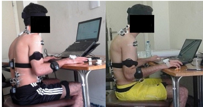
شکل ۱. شرکت کننده در حین کار با لپ تاپ در تنظیمات عادی (سمت راست) و ارگونومیک (سمت چپ)