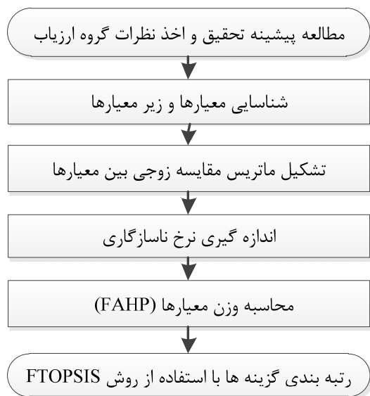
شکل ۱. چارچوب روش پیشنهادی

با توجه به افزایش و رشد پروژه‌های بلندمرتبه‌سازی و خطرات ویژه این نوع ساخت‌وسازها، ارزیابی فرهنگ ایمنی در کارگاه‌های بلندمرتبه‌سازی از اهمیت و ضرورت به‌سزایی برخوردار است. بنابراین کارگاه مورد مطالعه، یک برج اداری-تجاری ۳۳ طبقه فولادی است که در مرحله اجرای اسکلت فلزی و سفت‌کاری قرار داشته و بخشی از یک مگا پروژه تجاری-اقامتی و اداری با زیربنای کل حدود ۶۰۰،۰۰۰ مترمربع محسوب می‌شود. در شکل ۱ جزئیات روش پیشنهادی رتبه‌بندی مشاغل در کارگاه‌های بلندمرتبه‌سازی از نظر فرهنگ ایمنی با استفاده از مدل FTOPSIS-FAHP نشان داده شده است.