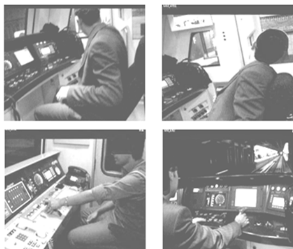
شکل ۱. مشاهده حرکات راهبران جهت واکاوی وظایف و ارزیابی بار کار فیزیکی

در این مرحله، از روش واکاوی وظیفه نظیر آن‌چه که روز و بیرمن (۲۰۱۲) و کارونن و همکاران (۲۰۱۱) در صنعت ریلی سنتی انجام دادند استفاده شد که در آن وظایف شغلی در یک فرایند سلسله مراتبی به مجموعه‌ای از زیر وظایف تقسیم شده و در قالب چارت ارائه گردید (۲، ۸). از روش‌های مختلفی برای تحلیل وظایف استفاده شد به این ترتیب که ابتدا مستندات و سوابق شغل راهبری به روش تحلیل محتوا مورد مطالعه قرار گرفت و وظایف یادداشت برداری گردید. سپس دو ارزیاب یکی به صورت مستقیم و دیگری از طریق فیلم برداری، حرکات و عمل‌کردهای ۲۱ راهبر را در خطوط ۱، ۲، ۳ و ۵ و پایانه‌های مترو ثبت و ضبط کردند (شکل ۱). مشاهدات