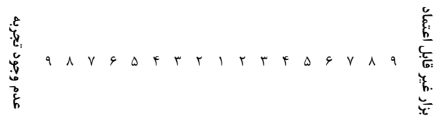
شکل ۲. نمونه ای از مقایسه دو به دو معیارها

سلسله مراتبی طراحی شده و دارای قابلیت تعیین ترجیحات و اولویت و محاسبه وزن نهایی گزینه‌ها را دارا می‌باشد (۲۹، ۳۰).