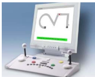
شکل (۴) - تست کامپیوتری 2Hand

Reaction Test (RT) (S 3 ): توانایی پاسخ سریع به تکانه های صوتی و تصویری را اندازه گیری می کند. متغیرهای اصلی در این تست میانگین زمان حرکت و میانگین زمان واکنش هستند که سرعت حرکت فیزیکی و سرعت تصمیم گیری را نشان می دهند. نمره پایین در این دو متغیر نشان دهنده عمل کرد خوب می باشد (شکل ۲).