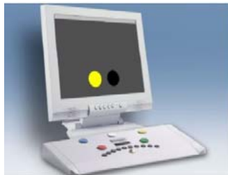
شکل (۲) - تست کامپیوتری RT