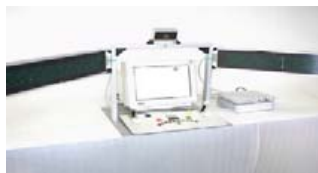
شکل (۳) - تست کامپیوتری PP