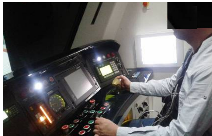
شکل (۲) - ثبت داده‌های فیزیولوژیک در حین راهبری

در این مطالعه HR/HRV و بارکار فکری درک شده و امتیاز عمل کرد به‌عنوان متغیرهای وابسته و سطوح مطالبه شغلی در سناریوهای مختلف راهبری به‌عنوان متغیرهای مستقل در نظر گرفته شدند. تفسیر داده‌های فیزیولوژیک زیر نظر یک متخصص فیزیک پزشکی و با استفاده از دستورالعمل انجمن کاردیولوژی اروپا و الکتروفیزیولوژی آمریکا انجام شد (۱۸). جهت اطمینان از قابلیت اعتماد داده‌های فیزیولوژیک ثبت‌شده با ECG، داده‌های ۵ دقیقه اول هر آزمون حذف شد. به دلیل این‌که داده‌های قلبی افراد مختلف به‌شدت تحت تأثیر اختلافات فردی است، واکنش‌های قلبی راهبران به درجات مختلف بارکار فکری شغلی با خود آن‌ها مقایسه شد و از مقایسه بین فردی خودداری گردید (۲۳). میانگین و انحراف معیار پارامترهای HR/HRV در دو سناریو مقایسه شد و به‌منظور آزمون فرضیه موردنظر از روش آماری ویلکاکسون استفاده گردید. به‌منظور