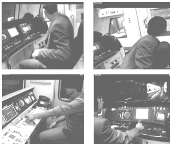
شکل ۱. مشاهده حرکات راهبران جهت واکاوی وظایف و ارزیابی بار کار فیزیکی

برای سنجش مواجهه بار کار فیزیکی به صورت کمی، از آن‌جا که شغل راهبر قطار جزء مشاغل استاتیک (نشسته و ایستاده توأم) به شمار می‌رود و در این گونه مشاغل، ریسک عامل فیزیکی اصلی، پوسچر نامناسب است (۹)، از ابزار ارزیابی سریع مواجهه (Quick exposure Check: QEC) استفاده شد. روش QEC برای ارزیابی سریع وظایف مختلف پس از یک آموزش مختصر