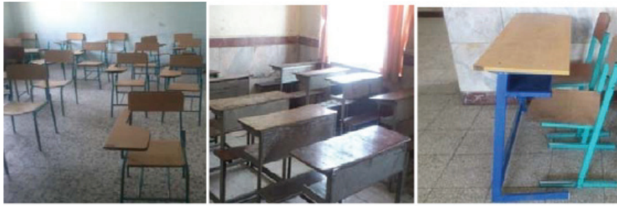
الف ب ج

شکل ۲: میز و نیمکت‌های مورد استفاده در مدارس ابتدایی شهر همدان (الف) میز مشترک با صندلی جدا (ب) میز و نشیمن گاه مشترک (ج) صندلی تک نفره