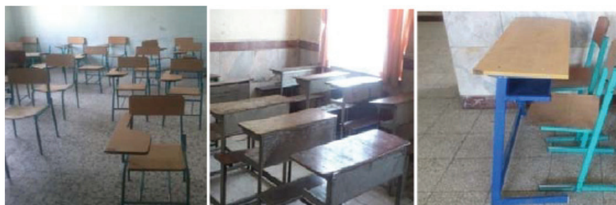
الف ب ج

شکل ۲: میز و نیمکت‌های مورد استفاده در مدارس ابتدایی شهر همدان (الف) میز مشترک با صندلی جدا (ب) میز و نشیمن‌گاه مشترک (ج) صندلی تک نفره