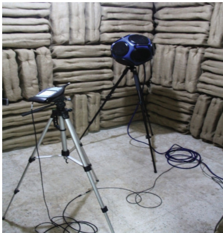
شکل ۱: ست اندازه‌گیری زمان بازآوایی به روش صدای منقطع

مرحله طراحی و نقشه اجرایی آکوستیکی اتاق با نرم افزار AutoCAD و MAX 3D قبل از کار با نرم افزار زمان بازآوایی مورد هدف، سطح جذب مورد هدف و سطح کلی مورد هدف در فرکانس معین شده به منظور طراحی با نرم افزار، تعیین گردید.